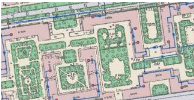
Рисунок 8.6. Пример карты с загруженными слоями

Разработчики приложений могут получить доступ ко всем параметрам карты через объект MapDoc.