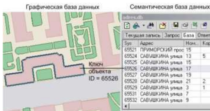
Рисунок 8.2. Пример взаимодействия семантической и графической баз данных

Для описания объектов графической базы данных (например, домов) создается семантическая база данных, в которую заносится информация по каждому дому: адрес, номер дома, тип дома и т.п. Для связи семантической и графической баз данных одно из полей семантической базы данных содержит ключ объекта графической базы, к которому относится одна или несколько строк семантической базы. При этом графическая и семантическая базы данных могут находиться в разных каталогах, на разных дисках и даже на разных компьютерах (сервере и локальном компьютере).