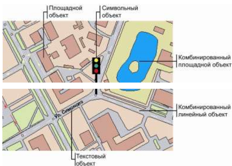
Рисунок 8.5. Примеры объектов

Текстовый объект описывается текстовой строкой, координатами точки привязки левого нижнего угла прямоугольника, в который вписан текст, углом поворота, высотой шрифта (в сантиметрах на местности). Объект может отображаться заданным цветом и стилем шрифта. Так как высота текста описана в сантиметрах на местности, то текст масштабируется в соответствии с масштабом окна карты.